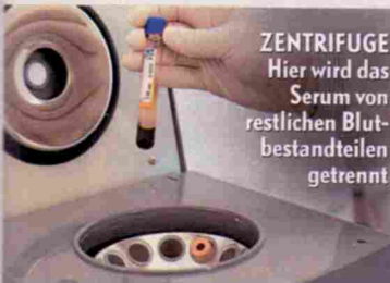
ZENTRIFUGE Hier wird das Serum von restlichen Blutbestandteilen getrennt

„Wenn man mal die 60 überschritten hat, wird man hellhörig, wenn es neue, nicht