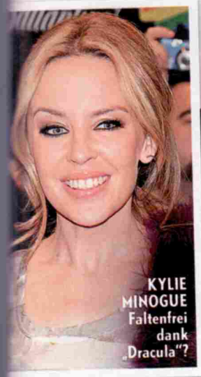
KYLIE MINOGUE Faltenfrei dank „Dracula“?